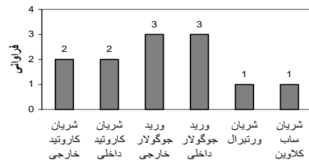
نمودار 1- فراوانی آسیب‌های عروق اصلی در مصدومین ترومای نافذ گردن

تحت نظر بودند که در نهایت به دلیل منفی بودن بررسی‌های تشخیصی، نیاز به جراحی پیدا نکردند. از مجموع 30 بیماری که تحت عمل جراحی گردن قرار گرفتند 12 نفر (40 درصد) آسیب عروق اصلی نمودار شماره 1) و 11 نفر (36/7 درصد) آسیب احشایی داشتند نمودار شماره 2).