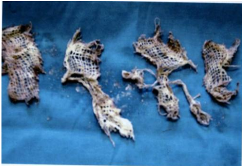
تصویر 2- نمای جسم خارجی برونش که تقریباً به طور کامل خارج شده است.

بعد از شستشو با سرم نرمال سالین راههای هوایی کاملاً تمیز و بدون جسم خارجی بود ولی مختصر التهاب مشاهده می شد. در آزمایشات ارسال شده ترشحات برونش از نظر باسیل سل و بدخیمی منفی بود و فقط حاوی نوتروفیل فراوان بود. بیمار در حین و پس از انجام برونکوسکوپی دچار عارضه ای نشد. 3 هفته بعد از خروج جسم خارجی بیمار با حال عمومی خوب و بدون علائم تنفسی مراجعه نمود.